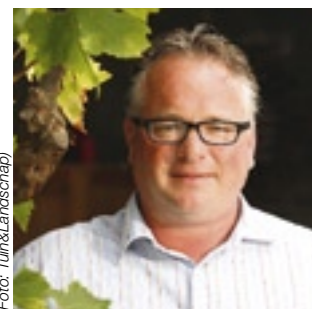
Winnaar vak- en persjury Tuin van het Jaar 2009

Dit jaar organiseerde het Hoveniers Informatiecentrum (HIC) alweer voor de tiende keer de competitie Tuin van het Jaar. Een deskundige jury beoordeelde ook dit jaar vele tuinen op aanleg en ontwerp. In dit jubileumjaar gebeurde wat in al die tien jaar nog niet eerder voorkwam: Vak- en persjury waren unaniem in hun oordeel. Maandag 5 oktober jl. werd de winnaar der winnaars bekend gemaakt.